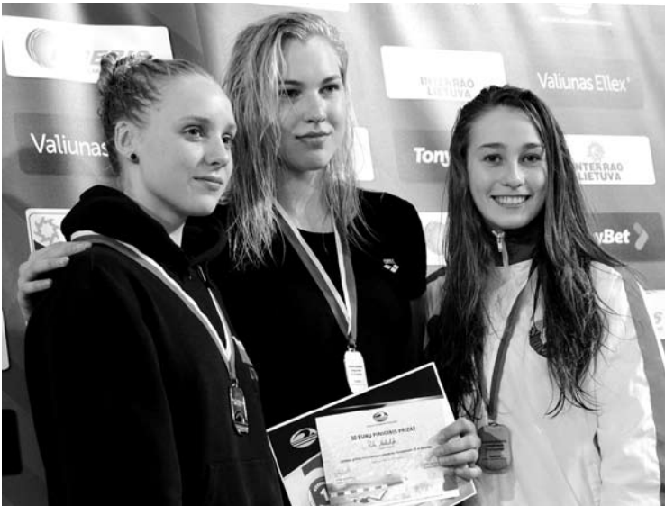
Tituluočiausia Lietuvos plaukikė Rūta Meilutytė (viduryje) Anykščių baseine buvo nepralenkiama.

Praėjusį ketvirtadienį Anykščiuose startavo tris dienas trukęs Lietuvos plaukimo čempionatas 25 metrų baseine. Ryškiausiai paskutinėse šių metų plaukimo varžybose spindėjo po gan ilgos pertraukos pasirodžiusi olimpinė čempionė Rūta Meilutytė.