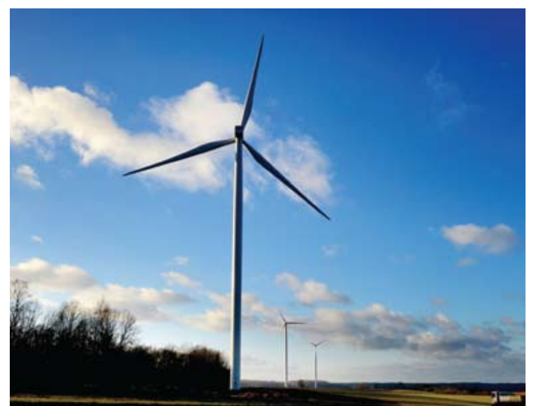
Pietiniame Anykščių rajono pakraštėje „Renerga“ pastatė 3 vėjo elektrines.

Ši bendrovė Anykščių rajone sėkmingai eksploatuoja 2002 metais pastatytą modernią mažąją Kavarsko hidroelektrinę, per metus gaminančią per 6 milijonus kWh elektros energijos. -ANYKŠTA